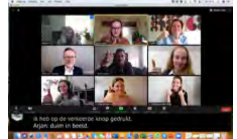
You2work in actie!

leeftijdsgrens van 27 jaar kan vervallen en het project hopelijk weer opgepakt kan worden in de toekomst.